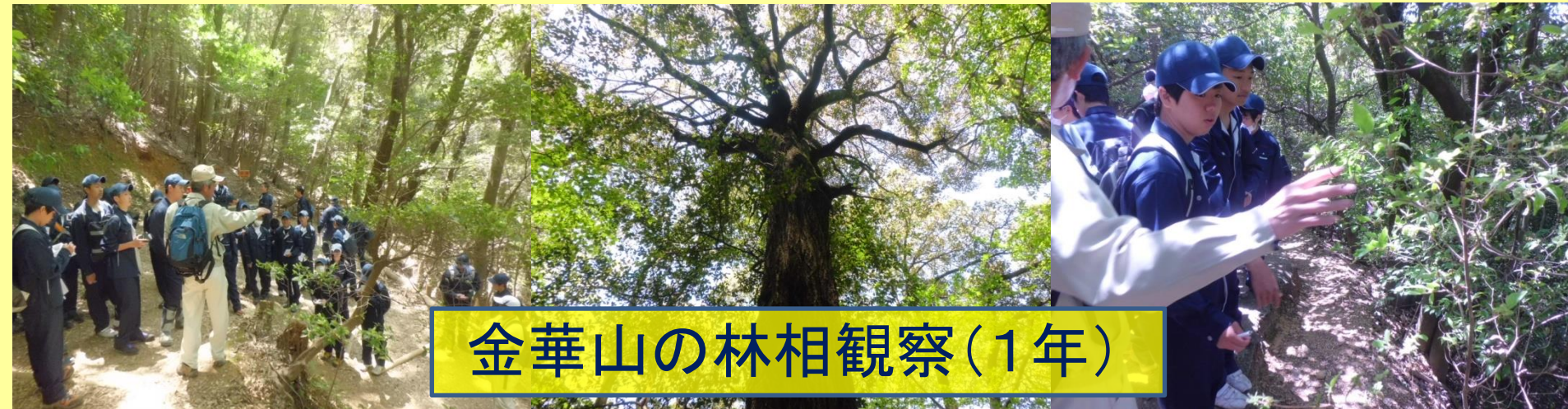
金華山の林相観察(1年)