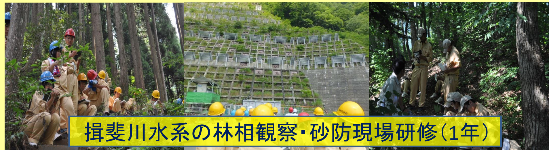
揖斐川水系の林相観察・砂防現場研修(1年)